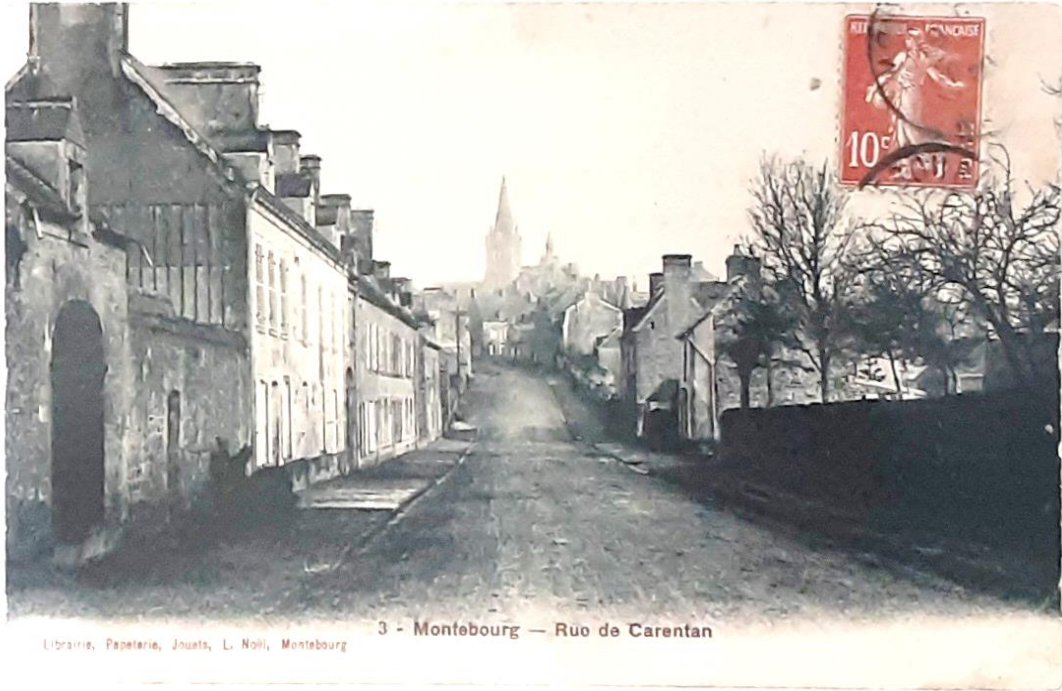
Librairie, Papeterie, Jouets, L. Noll, Montebourg